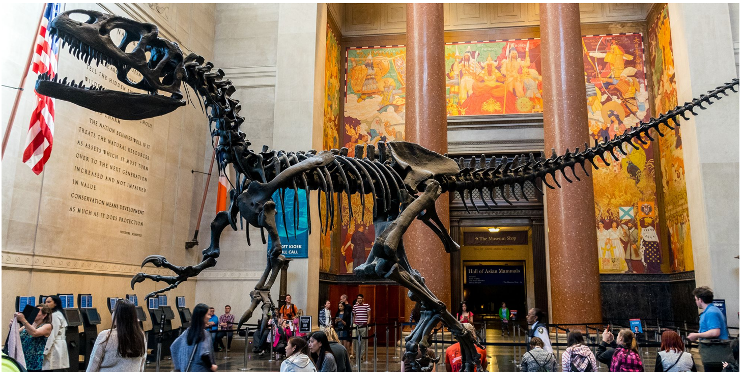
Dag 5: New York - Brussel

Als je de film "Night at the Museum" gezien hebt, dan ken je ook het American Museum of Natural History. In de film moet Larry de nachtwaker van het museum de diefstal van een magisch tablet verhinderen. Hij krijgt hierbij hulp van de tentoongestelde dieren, een dinosaurus, kleine miniatuurmens, ... die 's nachts tot leven komen. Al deze wezens staan in het museum en je kan deze dan ook ontdekken tijdens je bezoek.